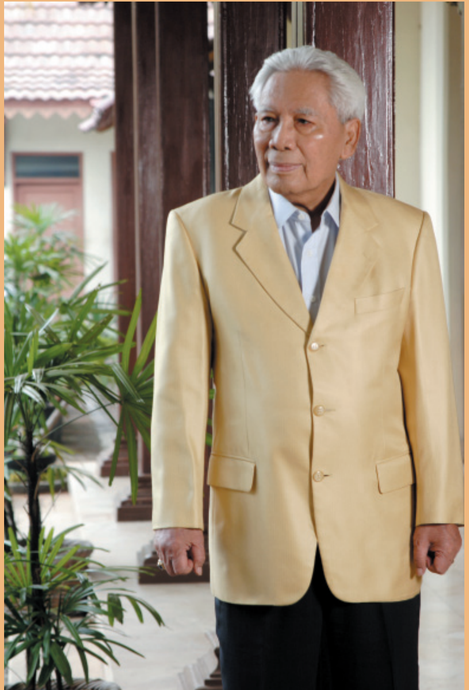
SUHARDIMAN MASIH FIT DALAM USIA 82 TAHUN

D R Suhardiman bukan saja dikenal sebagai tokoh nasional, organisator ulung dan politikus yang disegani. Ia juga digelar sebagai “dukun politik” dengan ramalan-ramalannya politiknya yang sering membuat heboh. Ia juga termasuk pentolan, pembina salah satu jenis olah raga beladiri yang mengandalkan