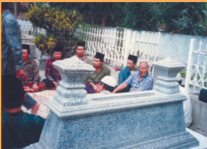
ZIARAH DIMAKAM ORANGTUANYA