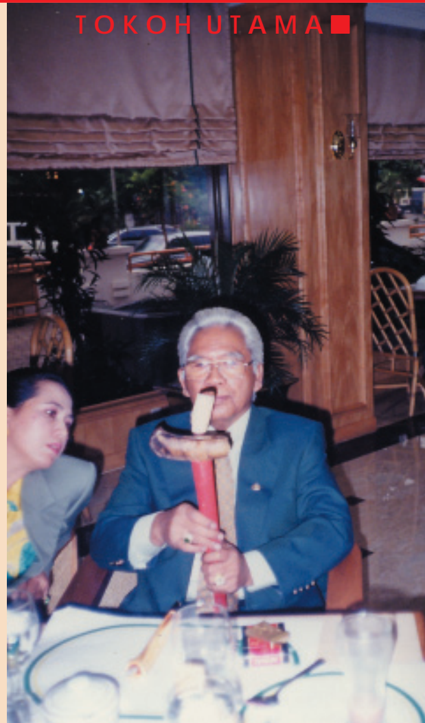
KERIS WARISAN ORANG TUA