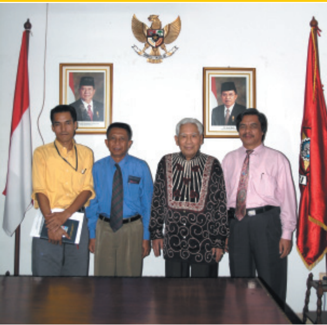
SUHARDIMAN DIAPIT TIGA WARTAWAN TOKOH INDONESIA