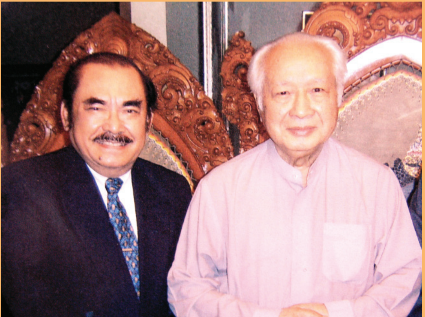
HARYONO SUYONO DAN PAK HARTO

H aryono mengalami beberapa kejadian unik dan lucu dalam perjalanan karirnya. Di antaranya, dipanggil mendadak oleh Presiden untuk makan singkong goreng. Juga pernah melompat dari helikopter dan Presiden 'melapor' kepadanya, serta pengalaman terperosok.