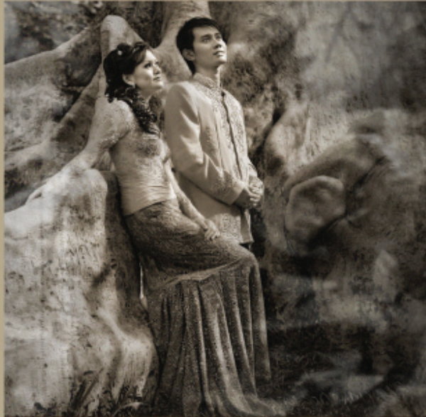
PHOTO digital photo indoor • digital photo outdoor • digital video shooting • kiddy photo • glamour photo • graduation photo • family photo • candid photo • BRIDAL wedding package • wedding gown design • party gown design • SALON brides make up • party make up • kebaya