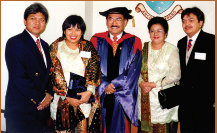
SAAT MENERIMA DOKTOR HC DARI MONASH UNIVERSITY, AUSTRALIA

B agi ahli komunikasi massa ini, bekerja keras dengan tulus, kreatif dan inovatif, mengalir laksana alunan musik symphoni dalam kehidupannya sehari-hari. Dinikmati sedemikian indah untuk mewujudkan impian menjadi rahmat bagi orang lain dan alam semesta.