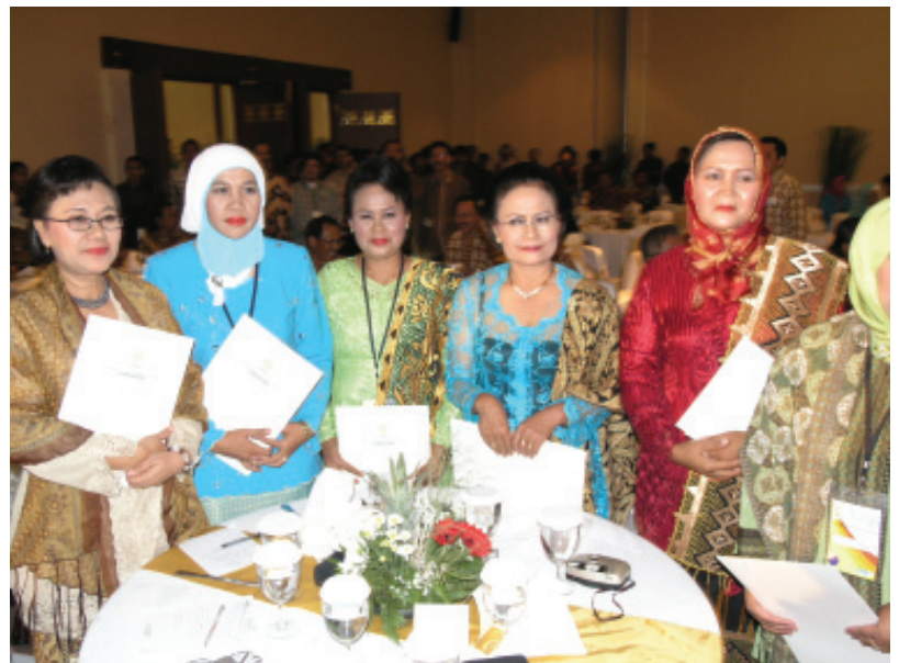
PARA NOMINASI BIDAN TERBAIK

Namun karena keluarga-keluarga itu pada umumnya miskin, atas petunjuk Presiden modal awal tabungan itu disumbang oleh para pengusaha. Gerakan Keluarga Sadar Menabung itu kemudian dicanangkan oleh Presiden pada tanggal 2 Oktober 1995 dan tabungan para keluarga pra sejahtera dan keluarga sejahtera I itu kemudian terkenal sebagai Tabungan Keluarga Sejahtera atau