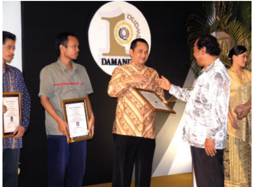
PANITIA SERAHKAN PIAGAM KEPADA PARA PEMENANG SAYEMBARA MENULIS DAMANDIRI

Bantuan pinjaman dalam skim kredit itu adalah untuk modal kerja bagi keluarga-keluarga Pra Sejahtera dan Sejahtera I yang dikenal dengan Kredit Usaha Keluarga Sejahtera (KUKESRA), di mana para nasabah diwajibkan untuk menabung dalam tabungan yang dikenal dengan nama Tabungan Keluarga Sejahtera (Takesra).