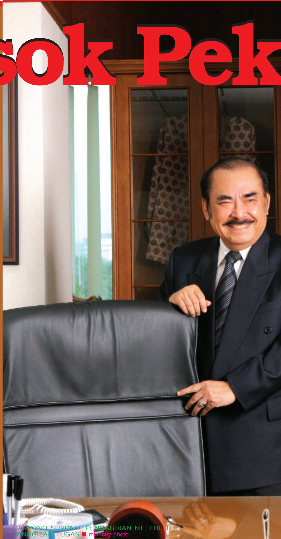
HARYONO SUYONO, PENGABDIAN MELEBIHI PANGGILAN TUGAS

Bekerja keras dengan tulus, kreatif dan inovatif. Itulah salah satu yang patut diteladani dari mantan Menteri Negara Kependudukan ini. Dia seperti tidak kenal lelah, sepanjang hari bekerja keras dengan kreatif bahkan sampai melebihi panggilan tugasnya. Dia juga seorang tokoh yang terbuka, bersahaja dan teguh pada prinsip. Dia pejabat Orde Baru yang karya pengabdianya belum tertandingi hingga saat ini, di bidang kependudukan dan keluarga sejahtera.