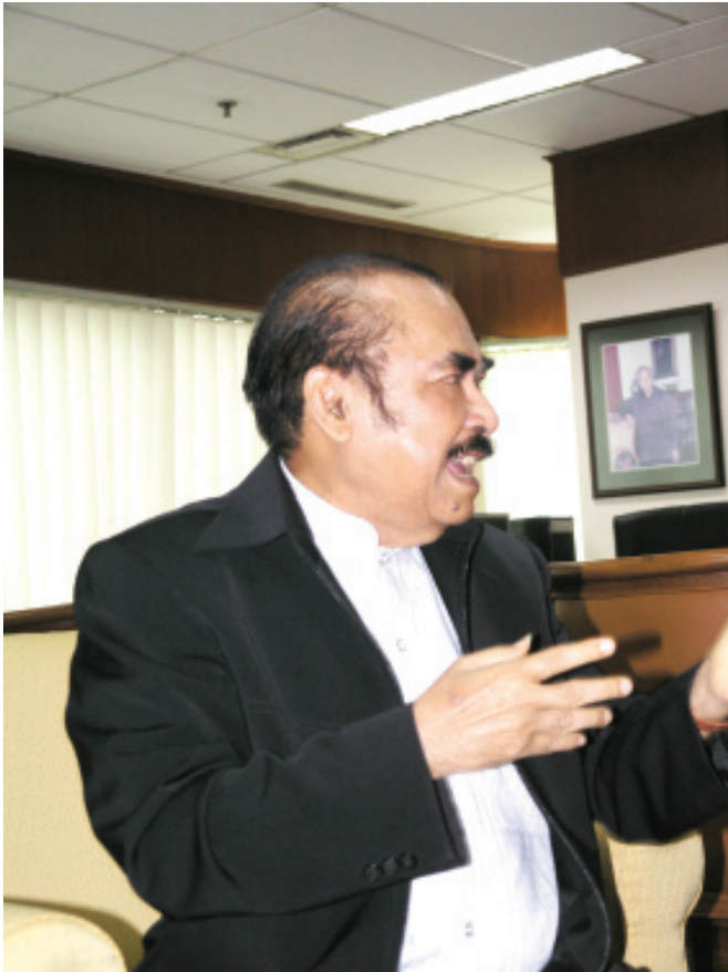
HARYONO SUYONO, PASTI INGAT KB

Ingat Haryono, pasti ingat kabe (keluarga berencana). Sebaliknya, ingat kabe, pasti ingat Haryono. Ini cerminan betapa melekatnya nama Haryono Suyono bagi keberhasilan program KB di Indonesia. Bahkan, keberhasilannya memimpin gerakan KB di Indonesia sangat monumental.