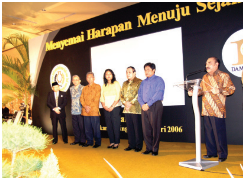
YAYASAN DAMANDIRI, SUPERSEMAR, GOTONG-ROYONG DAN GN-OTA BANTU KORBAN BENCANA