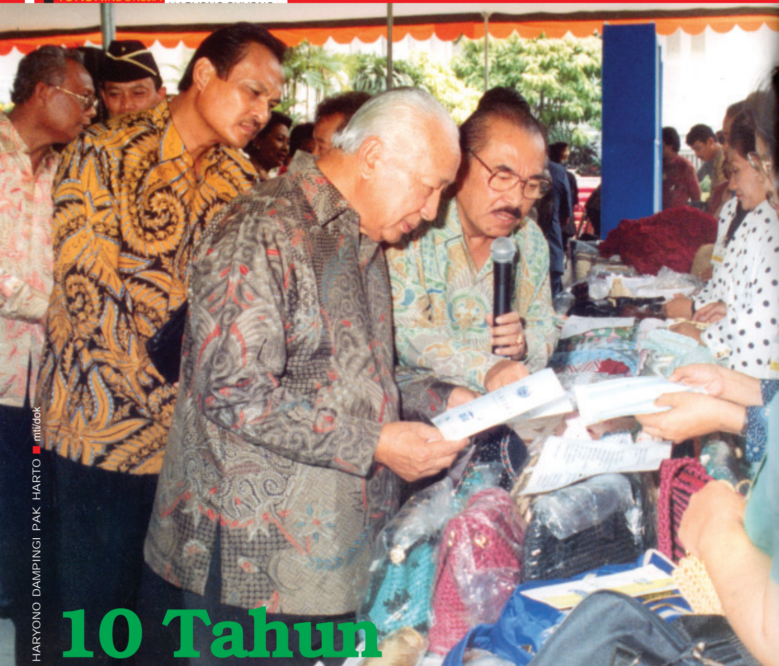
HARYONO DAMPINGI PAK HARTO ■ miti/dok