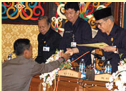
KETUA DPRD DISAKSIKAN SEKWILDA KUKAR MENERIMA KATA AKHIR FRAKSI GOLKAR