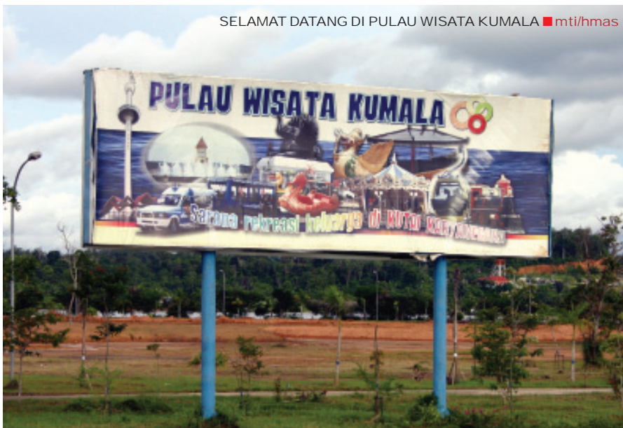
SELAMAT DATANG DI PULAU WISATA KUMALA

Salah satu objek wisata menarik adalah bekas keraton Kesultanan Kutai Kartanegara yang dijadikan Museum Mulawarman. Museum ini menjadi primadona bagi para