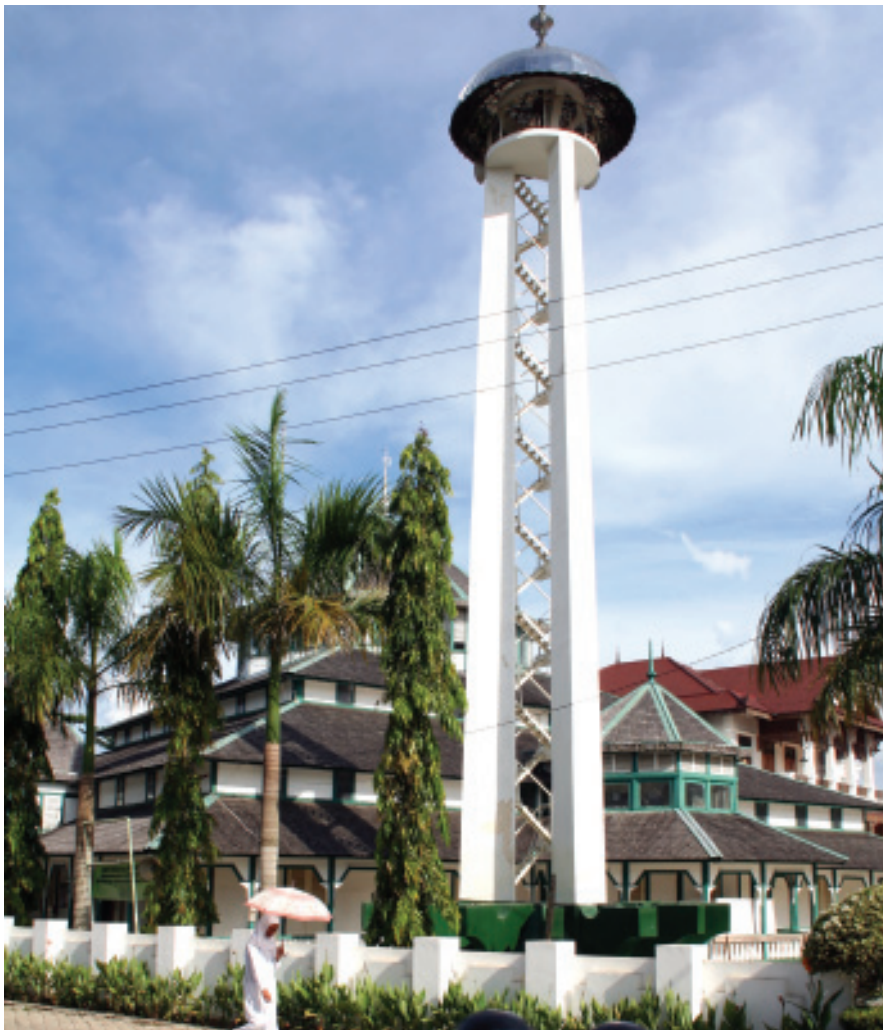
MENARA MASJID KESULTANAN KUTAI KARTANEGARA ■ mti/mlp

Kekayaan budaya salah satu keagungan dari Kutai Kartanegara (Kukar). Masyarakat Kukar yang terdiri dari banyak suku dan sub suku, memiliki agama dan bahasa yang beragam. Juga memiliki bermacam-macam alat musik, baik berupa alat musik petik, pukul dan tiup. Kaya dengan seni drama dan seni tari juga seni pahat patung dan arsitektur.