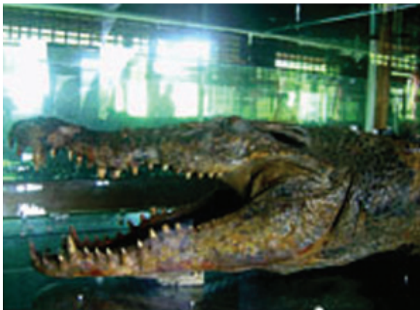
MONSTER BUAYA YANG DIAWETKAN

Kawasan wisata alam Waduk Panji Sukarame terletak sekitar 3 km dari