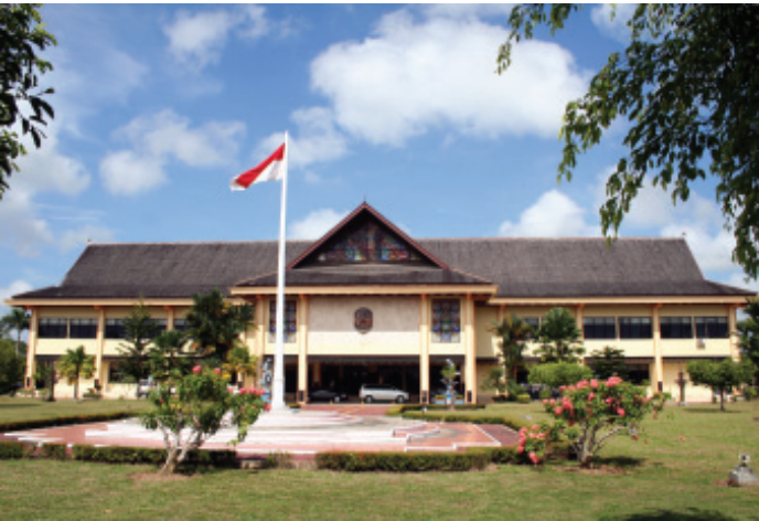
GEDUNG DPRD KAB KUTAI KARTANEGARA