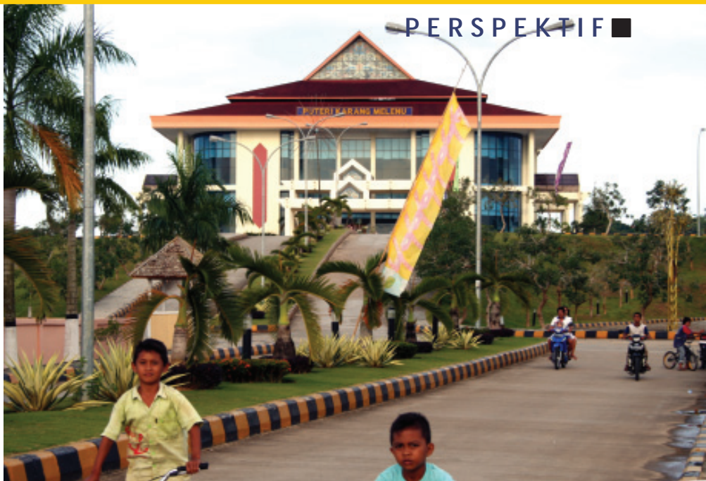
GEDUNG PUTERI KARANG MELENU DI TENGGARONG SEBERANG

Ketiga , masyarakat memiliki tekad dan semangat yang kuat untuk merubah kultur/