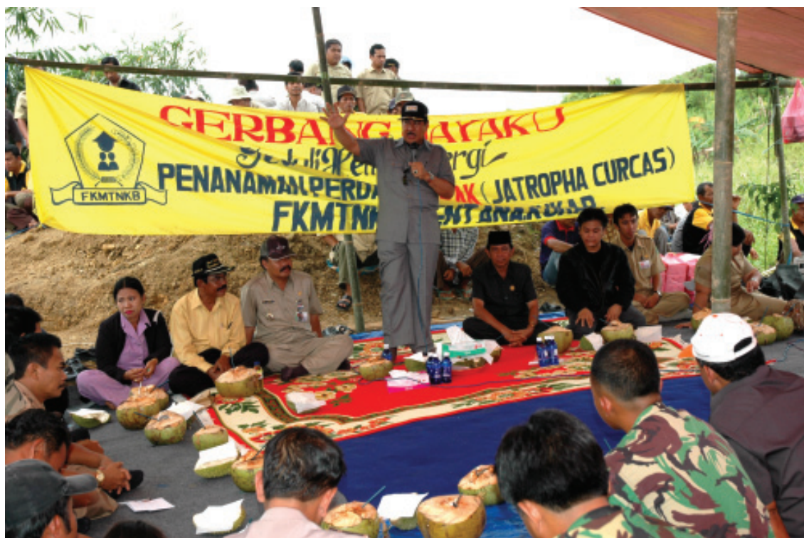
HSYAUKANI HR GERAKAN PENANAMAN POHON JARAK UNTUK ENERGI ALTERNATIF

Jl. Muso Bin Salim No. 06 Tenggarong 75512 Kaltim INDONESIA Telp: +62 541 661122 Fax: +62 541 664881 E-mail: bpmd@bpmdkukar.go.id