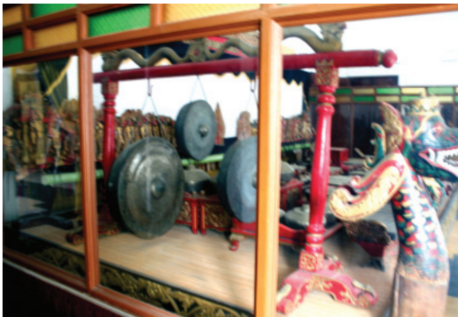
ALAT MUSIK DI MUSEUM MULAWARMAN ■ mti/mlp

Lamin kediaman bangsawan dan kepala adat