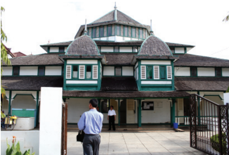
MASJID KESULTANAN KUTAI KARTANEGARA ■ mti/mlp

upacara baik yang berhubungan dengan siklus hidup dan kehidupan manusia (kelahiran, kematian, perkawinan, sakit, dsb) dan upacara yang berkaitan dengan siklus pertanian. Dalam menyelenggarakan upacara-upacara ini, masing-masing suku memiliki variasinya sendiri-sendiri.