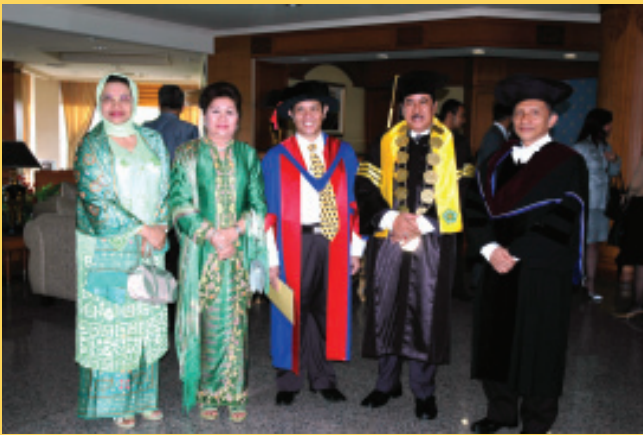
AMIEN RAIS & ISTERI HADIRI PENGUKUHAN PROFESOR

sangat peduli pada dunia pendidikan. Kepedulian pada dunia pendidikan itu dibuktikannya dari diri sendiri. Di tengah kesibukannya sebagai Bupati Kutai Kartanegara dan Ketua Apkasi (Asosiasi Pemerintah Kabupaten Seluruh Indonesia) tahun 2000-2004, dia masih menyempatkan diri mengikuti Program Pascasarjana Institut Pertanian Bogor hingga meraih gelar Doktor Ilmu Kehutanan tahun 2004.