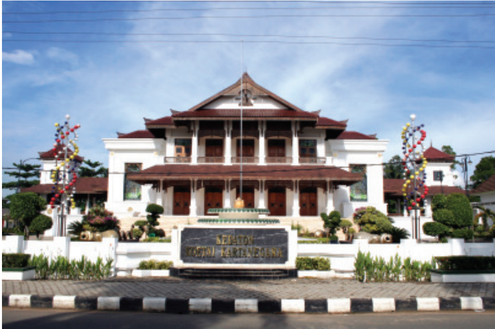
KEDATON KUTAI KARTANEGARA DI PUSAT KOTA TENGGARONG ■