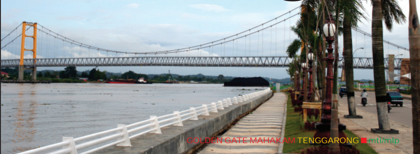
GOLDEN GATE MAHAKAM TENGGARONG