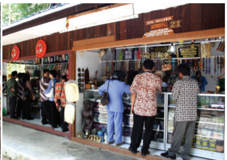
BERBAGAI SOUVENIR KHAS KUTAI KARTANEGARA TERSEDIA DI KOMPLEKS MUSEUM MULAWARMAN ■ mti/mlp