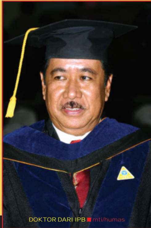
DOKTOR DARI IPB

menyampaikan orasi ilmiah pengukuhanannya sebagai profesor berjudul: Reorientasi Strategi