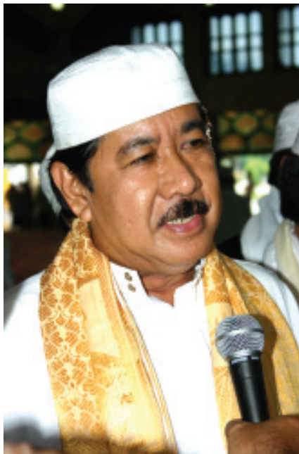
H SYAUKANI HR ■ mti/humas

Dengan demikian setiap individu berhak dan wajib menyumbangkan potensinya dalam gerakan pembangunan tersebut. Dalam paradigma ini, sekecil dan selemah apapun kualitas SDM dan