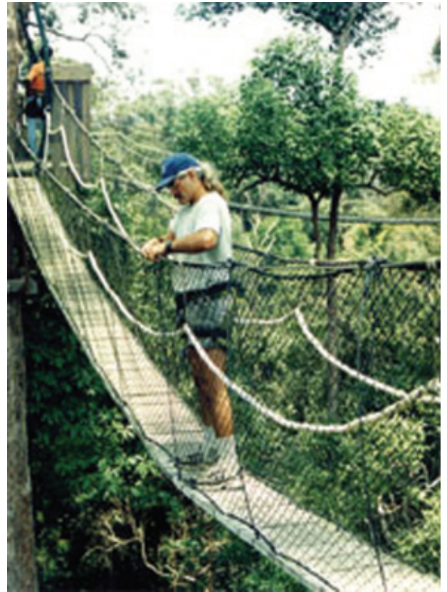
CANOPY BRIDGE WISATA ALAM BUKIT BANGKIRAI

Di kawasan hutan lindung ini juga terdapat berbagai jenis fauna. Di antaranya, Owa-Owa ( Hylobates muelleri ), Beruk ( Macaca nemestrina ), Lutung Merah ( Presbytus rubicunda ), Monyet Ekor Panjang ( Macaca fascicularis ), Babi Hutan ( Susvittatus ), Bajing Terbang (Squiler) serta Rusa Sambar ( Corvus unicolor ) yang telah ditangkarkan.