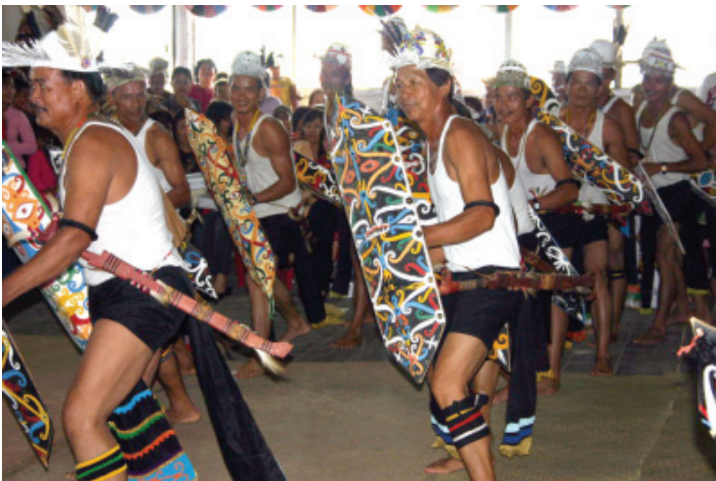
KEANGUNGAN TARI PERANG

Kutai Barat) yang memakan waktu bertahun-tahun.