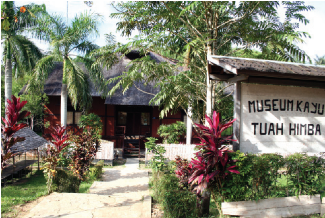
MUSEUM KAYU TUAH HIMBA, TENGGARONG, KUKAR ■ mti/mlp

memangsa seorang pria bernama Baddu (40) di Tanjung Limau, Kecamatan Muara Badak (Kabupaten Kukar) ditangkap pada tanggal 10 April 1996. Buaya berkelamin betina ini memiliki panjang 5,5 meter, berat 200 kg dengan lingkaran perut sekitar 1 meter.