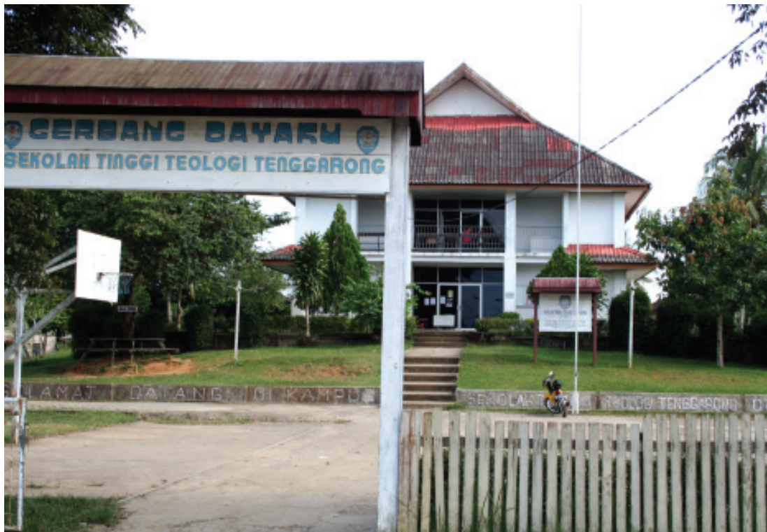
SEKOLAH TINGGI TEOLOGIA TENGGARONG ■ mti/mlp

Suku Tunjung mendiami daerah kecamatan Melak, Barong Tongkok dan Muara Pahu. Suku Bahau mendiami daerah kecamatan Long Iram dan Long Bagun. Suku Benuaq mendiami daerah kecamatan Jempang, Muara Lawa, Damai dan Muara Pahu. Suku Modang mendiami daerah kecamatan Muara Ancalong dan Muara Wahau. Suku Penihing, suku Bukat dan suku Ohong mendiami daerah kecamatan Long Apari. Suku Busang mendiami daerah kecamatan Long