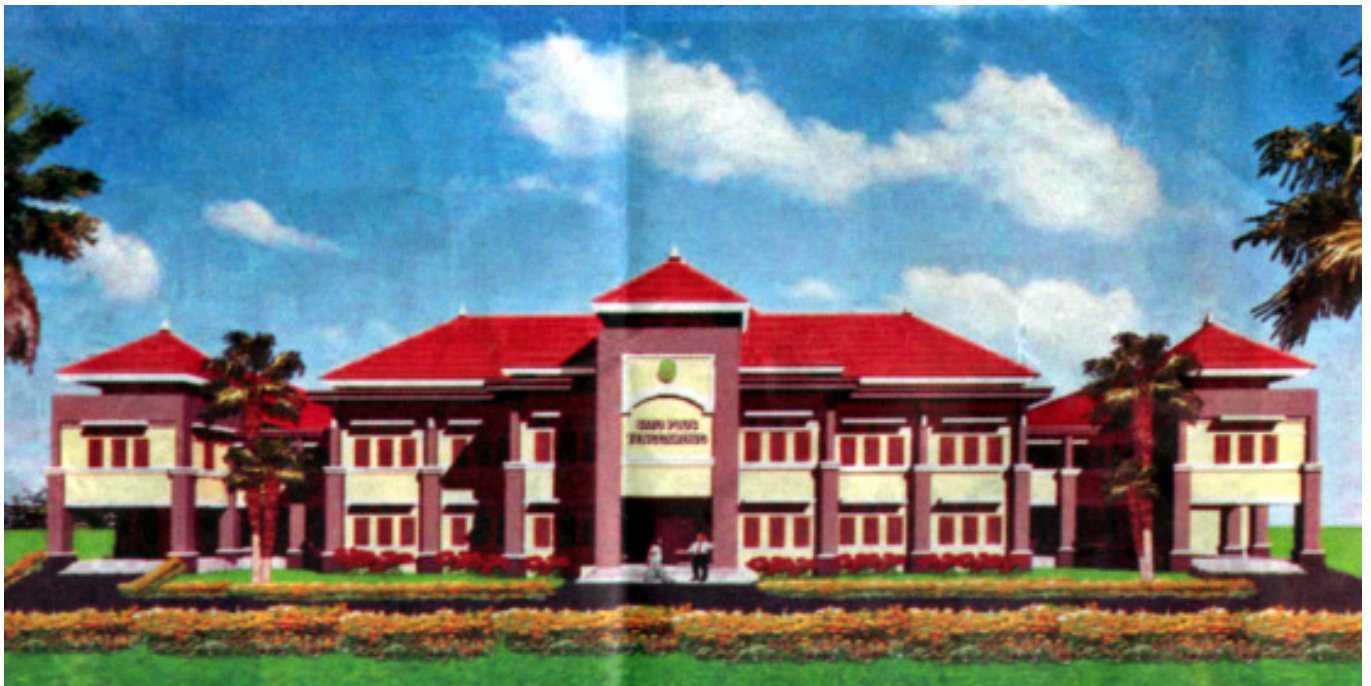
MAKET GEDUNG UNIVERSITAS KUTAI KARTANEGARA, TENGGARONG

adalah Program Administrasi Publik. Fakultas yang akreditasinya paling bagus adalah Fakultas Ekonomi dan Sospol yakni akreditasi 'B'. Sehingga Sospol punya kewenangan atau kelayakan untuk membuka S2.