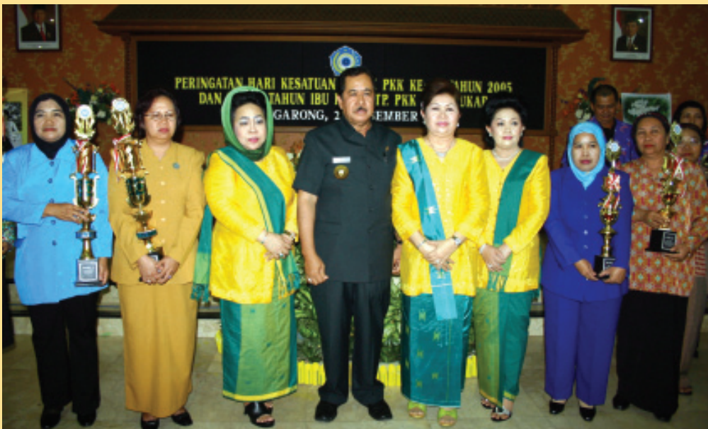
BERSAMA ISTERI DAN IBU-IBU PKK KUKAR