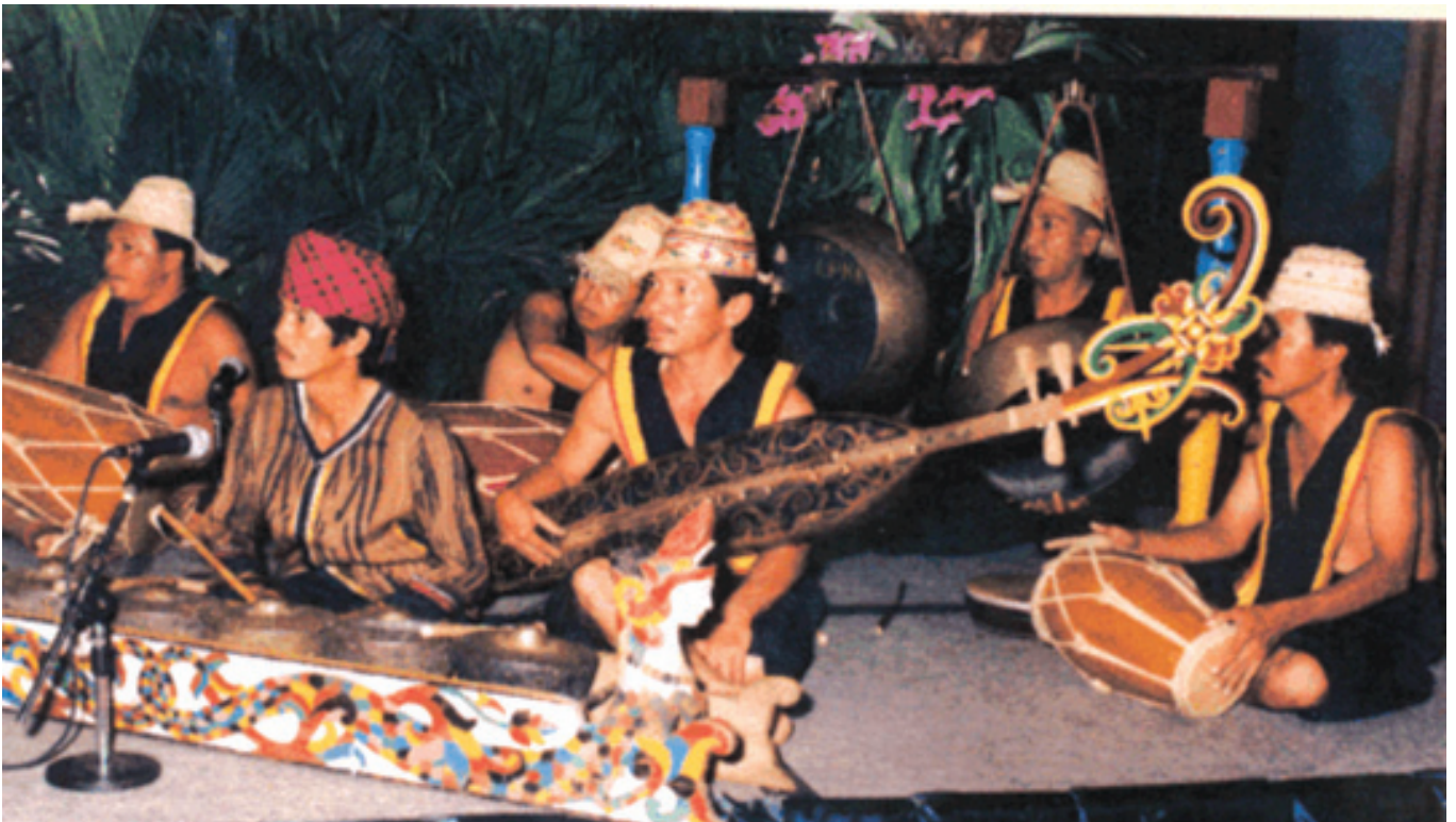
SENI MUSIK TRADISIONAL KUTAI ■ mti/humas

Tari Dewa Memanah adalah tari yang dilakukan oleh kepala Ponggawa dengan mempergunakan sebuah busur dan anak panah yang berujung lima. Ponggawa mengelilingi tempat upacara diadakan sambil mengayunkan panah dan busurnya ke atas dan ke bawah, disertai pula dengan bememang (membaca mantra) yang isinya meminta pada dewa agar dewa-dewa mengusir roh-roh jahat, dan meminta