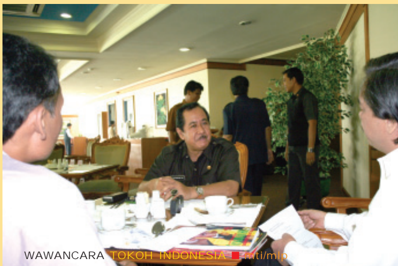
WAWANCARA TOKOH INDONESIA