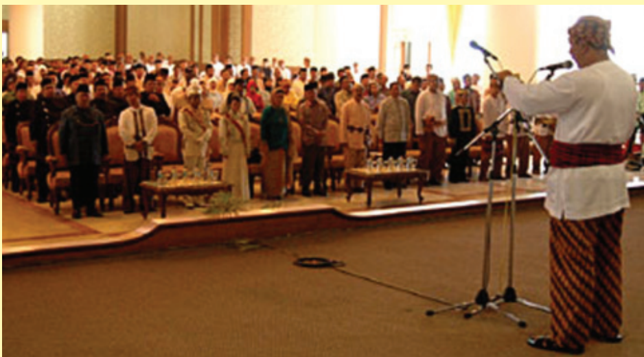
FAHMI WAKILI TIM INISIATOR BACAAN DEKLARASI SEMPEKAT KEROAN KUTAI