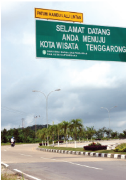
JALAN MENUJU TENGGARONG