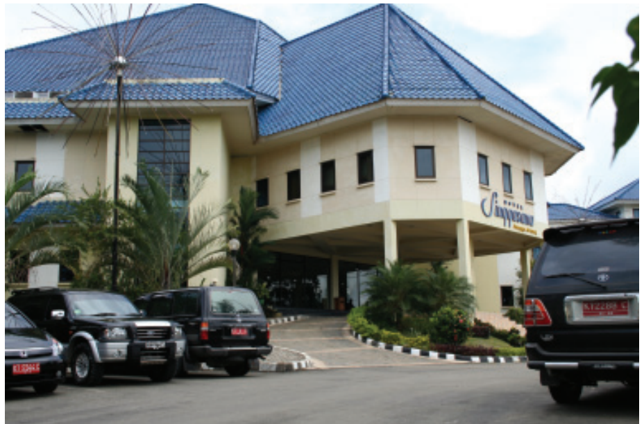
HOTEL SINGGASANA, TENGGARONG

Jongkang, Kecamatan Loa Kulu. Juga jalan akses ke Bandara yang menghubungkannya dengan Tenggarong dan Samarinda.