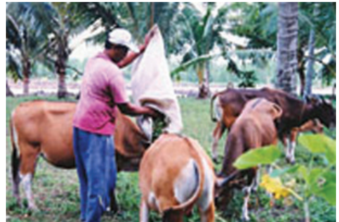
POTENSI PETERNAKAN KUKAR ■ mti/bpmd

Ulat sutra merupakan bahan baku kain yang berkualitas dan harganya sangat tinggi. Berdasar uji coba yang dilakukan Dinas Kehutanan, ulat sutra cocok