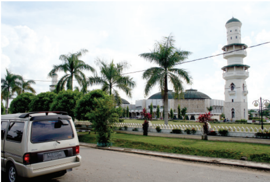
MESJID ANGUNG TENGGARONG ■ mti/mlp

Pahangai. Dan, Suku Bentian mendiami daerah kecamatan Bentian Besar dan Muara Lawa.