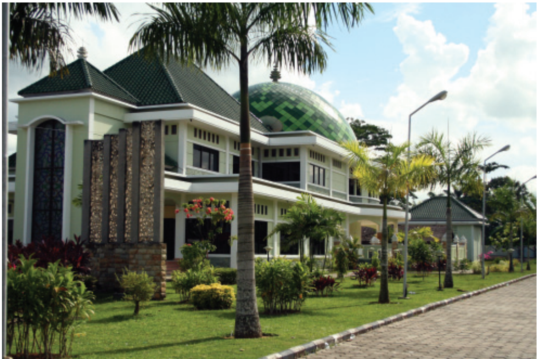
PLANETARIUM, TENGGARONG ■ mti/mlp

Bangunan megah bergaya arsitektur barat dan didominasi warna putih ini sangat memikat bagi para wisatawan. Bangunan ini dirancang oleh Estourgie dari Hollandsche Beton Maatschappij (HBM) dan dibangun pada tahun 1936 pada masa pemerintahan Sultan Adji Mohamad Parikesit. Para wisatawan selalu menyempatkan diri berpose di depan bekas keraton ini.