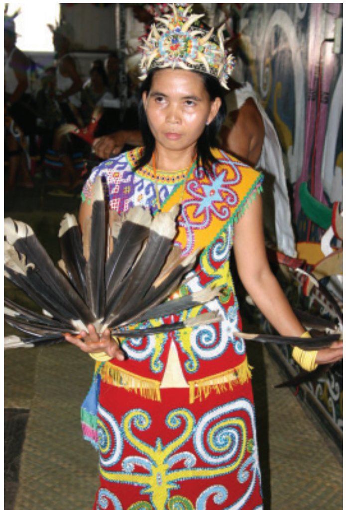
PENARI DAYAK

Tari Pecuk Kina, tarian yang menggambarkan perpindahan suku Dayak Kenyah dari daerah Apo Kayan (Kabupaten Bulungan) ke daerah Long Segar (Kabupaten