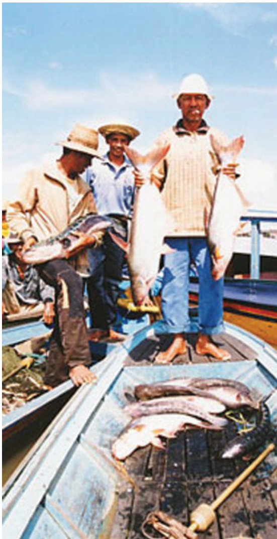
PERIKANAN ■ mti/humas

dibudidayakan di Kalimantan Timur, termasuk media penanaman murbay sebagai pakan ulat sutra. Selama ini belum ada investasi yang membudidayakan ulat sutra secara komersial. Padahal jika dilakukan budidaya secara intensif, ulat sutra akan memiliki prospek investasi yang cukup cerah.