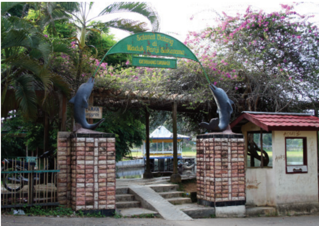
WADUK PANJI SUKARAME INDAH DAN PENUH MISTERI ■ mti/mlp