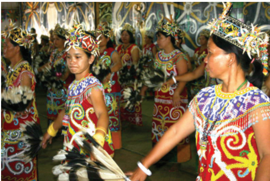
SENDRA TARI MASSAL, DAYA TARIK TERSENDIRI ■ mti/humas

Seni Tari Klasik, merupakan tarian yang tumbuh dan berkembang di kalangan Kraton Kutai Kartanegara pada masa lampau. Termasuk dalam Seni Tari Klasik Kutai adalah Tari Persembahan, Tari Ganjur, Tari Kanjar, Tari Topeng Kutai, dan Tari