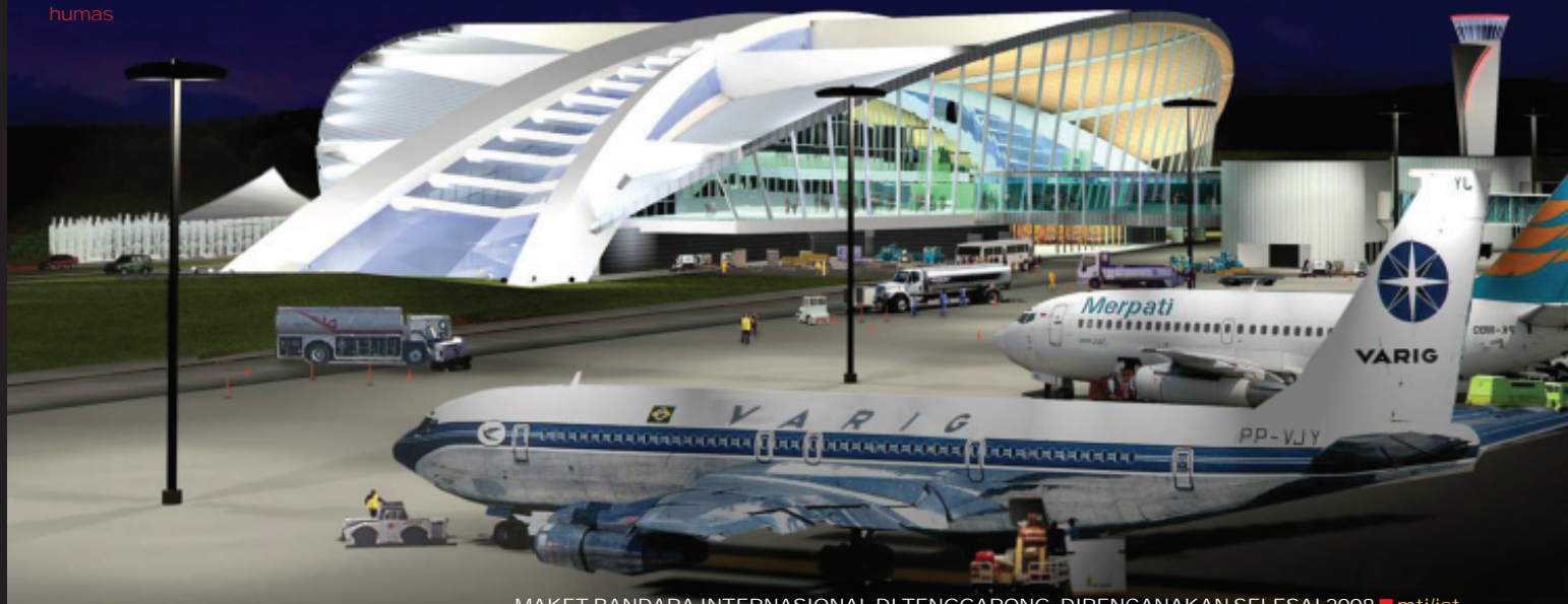
MAKET BANDARA INTERNASIONAL DI TENGGARONG, DIRENCANAKAN SELESAI 2008

Di kota Tenggarong, akomodasi juga sudah memadai. Ada dua hotel yang terbilang mewah. Satu di antaranya Hotel Singgasana, hotel berbintang tiga milik Pemda Kukar. Bahkan, demi memberi kemudahan bagi para wisatawan, investor dan juga bagi warga setempat untuk datang dan pergi mengunjungi Kutai Kartanegara, Pemerintah Kabupaten Kukar telah berencana membangun Bandar Udara (Bandara) Sultan Kutai berkelas internasional di desa