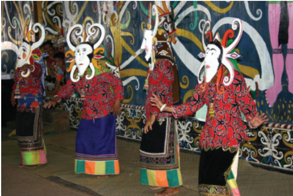
KUKAR KAYA KARYA SENI ■ mti/humas

ekor burung Enggang. Biasanya tari ini ditarikan di atas sebuah gong, sehingga Kancet Ledo disebut juga Tari Gong.