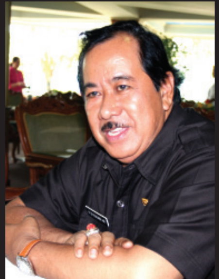
H SYAUKANI HR ■ mti/mlp

Di pusat Kota Raja Tenggarong, juga ada Museum Mulawarman bekas istana Kerajaan Kutai Kartanegara. Di sebelahnya terdapat bangunan baru keraton untuk tempat tinggal Sultan Kutai Kartanegara. Juga ada Planetarium