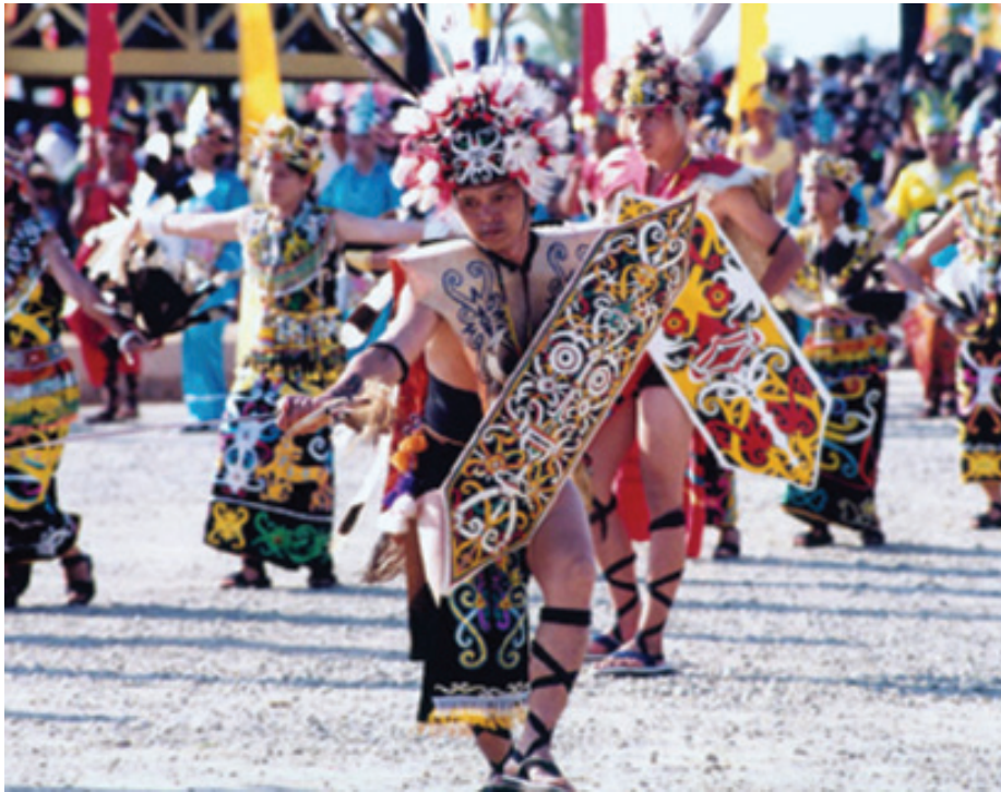
SAAT FESTIVAL ERAU

menggunakan alat yang bernama Ganjur (gada yang terbuat dari kain dan memiliki tangkai untuk memegang). Tarian ini diiringi oleh musik gamelan dan ditarikan pada upacara penobatan raja, pesta perkawinan, penyambutan tamu kerajaan, kelahiran dan khitanan keluarga