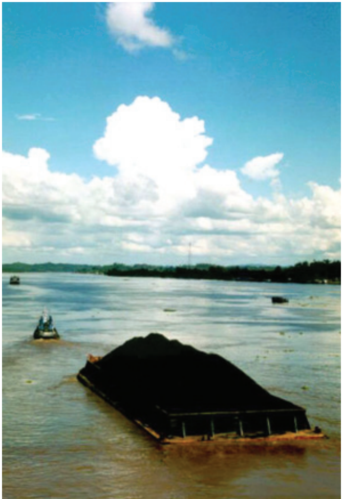
PONTON BATUBARA LEWAT SUNGAI MAHAKAM

Keempat , pengembangan Tenggarong Seberang berupa pengembangan Kota Tepi Sungai ( Water Front City ), diorama Jembatan Mahakam II, pengembangan Lokasi