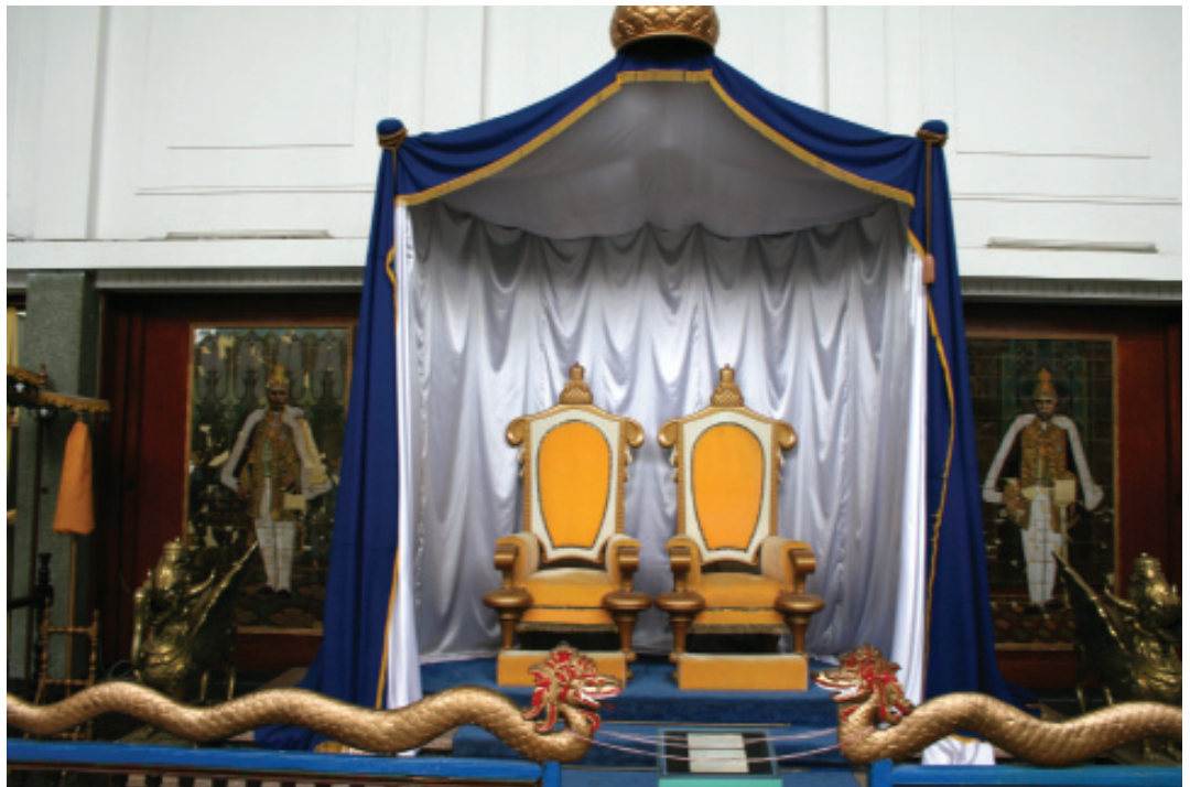
SINGGASANA SULTAN KUTAI KARTANEGARA

Museum Kayu "Tuah Himba" terletak di kawasan objek wisata Waduk Panji Sukarame atau sekitar 3 km dari pusat kota Tenggarong. Di Museum Kayu Tuah Himba, ini terdapat beraneka macam koleksi yang berkaitan dengan kehutanan. Di antaranya koleksi daun-daun kering ( herbarium ), koleksi biji-bijian, koleksi potongan log atau batang pohon yang tumbuh di pulau Kalimantan, alat-alat pengolah kayu, alat-alat dapur