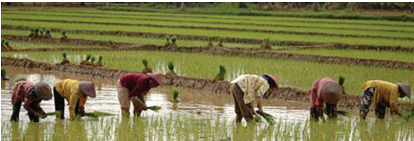
KUKAR BERTEKAD MENJADI LUMBUNG PADI KALIMANTAN TIMUR