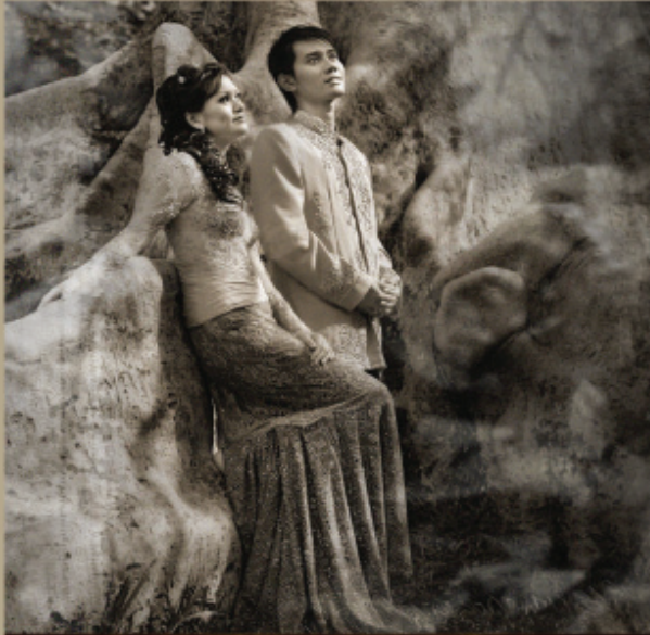
PHOTO digital photo indoor • digital photo outdoor • digital video shooting • kiddy photo • glamour photo • graduation photo • family photo • candid photo • BRIDAL wedding package • wedding gown design • party gown design • SALON brides make up • party make up • kebaya