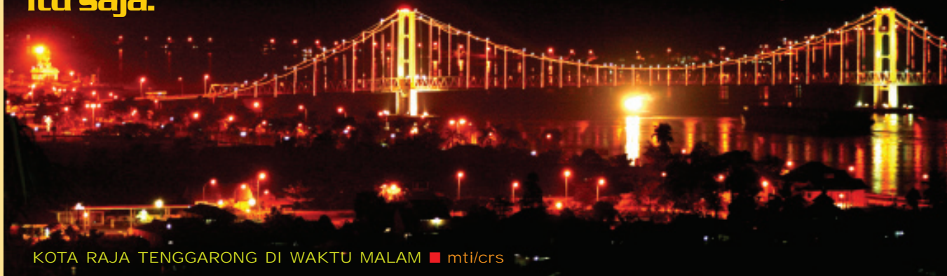
KOTA RAJA TENGGARONG DI WAKTU MALAM