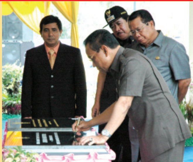
MENDAGRI RESMIKAN RSUD KUKAR