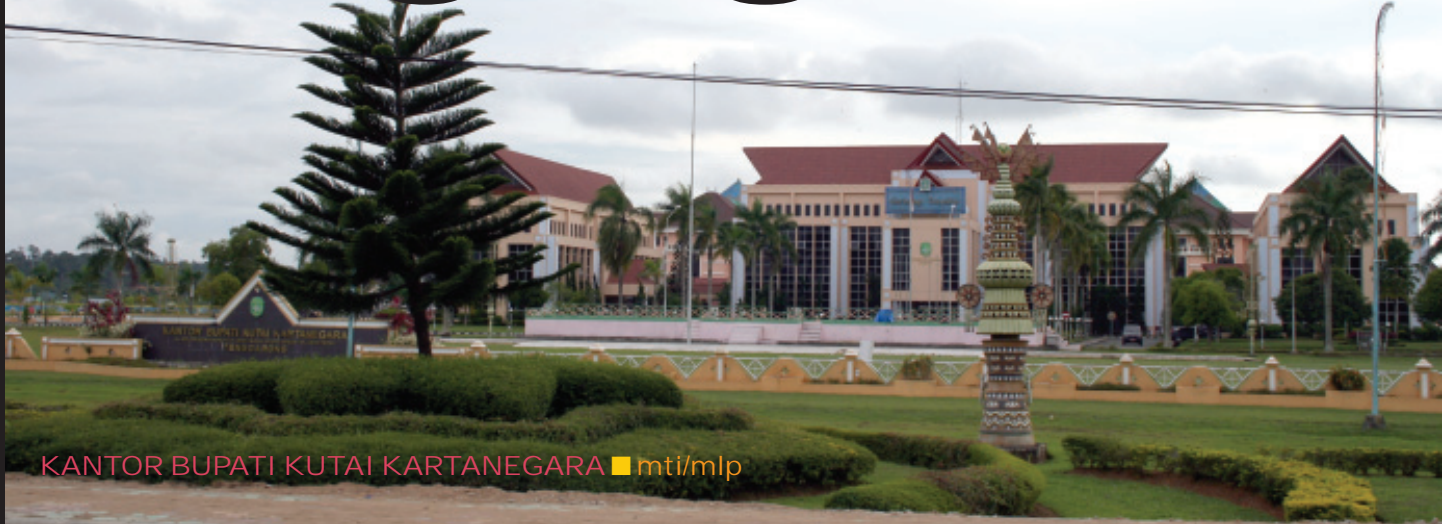
KANTOR BUPATI KUTAI KARTANEGARA ■ mti/mlp