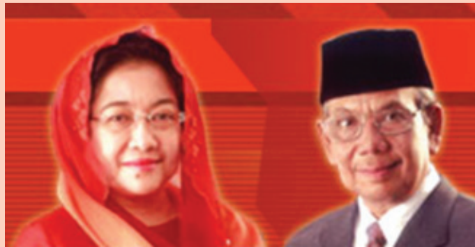
MEGA-HASYIM, TERBUKTI

Selain itu, Mega-Hasyim berjanji melaksanakan program khusus sektor keagamaan, buruh, guru, nelayan, petani, pegawai negeri sipil, dan profesional. Sasaran utama adalah memperkokoh NKRI sebagai manifestasi prinsip kedaulatan, mendidik Indonesia bukan negara theokrasi, mewujudkan persamaan warga negara, mewujudkan kedaulatan rakyat melalui penguatan kelembagaan, mekanisme, dan praktek politik demokratis, serta mengukuhkan martabat bangsa melalui pembangunan karakter, kepribadian, dan