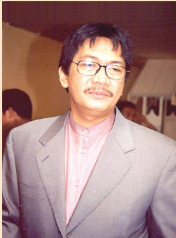
DEDDY MIZWAR ■ e-ti/rpr-int

Memulai karier di film pada 1976, Deddy bekerja keras dan mencurahkan kemampuan aktingnya, di berbagai film yang dibintangi. Pertama kali main film, dalam Cinta Abadi (1976) yang disutradarai Wahyu Sihombing, dosennya di LPKJ, dia langsung mendapat peran utama. Puncaknya, perannya di film Naga Bonar kian mendekatkannya pada popularitas. Kepiawaiannya berakting membuahkan hasil dengan meraih 4 Piala Citra sekaligus dalam FFI 1986 dan 1987 diantaranya: Aktor Terbaik FFI dalam