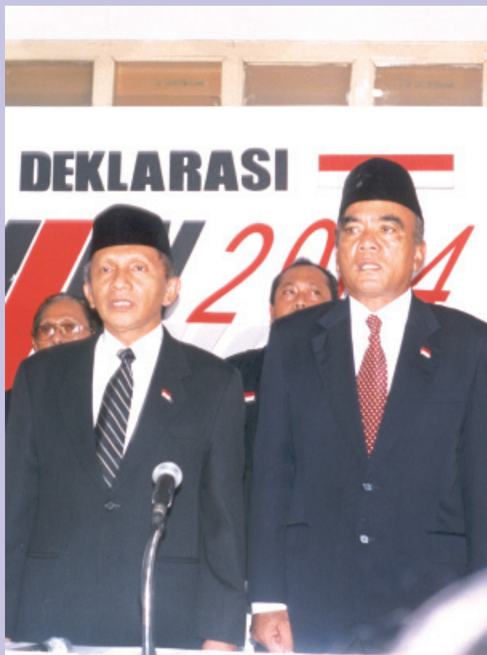
AMIEN-SISWONO, BERANI, JUJUR DAN CERDAS ■ e-ti/ms

yang akan mereka anut sebagai landasan bekerja adalah, pertumbuhan ekonomi tinggi dengan pasar domestik sebagai andalannya, pemerataan kesejahteraan ekonomi dan sosial rakyat, serta pengembangan lingkungan multidimensi yang stabil, seimbang, harmonis, aman, dan tertib.