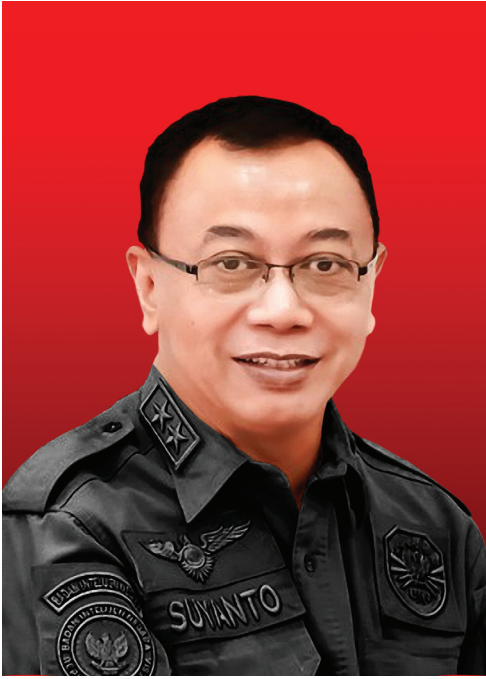
Mayor Jenderal TNI Dr. Suyanto, SE, MSi, Han

kan kehidupan pengorbanan sementara kesederhanaan menawarkan kehidupan kesempatan. Kesederhanaan menciptakan peluang untuk pemenuhan yang lebih besar dalam pekerjaan/hubungan yang bermakna dengan orang lain, perasaan kekerabatan dengan semua kehidupan, dan kekaguman akan alam semesta yang hidup. Ini adalah cara hidup yang kaya yang menawarkan alternatif yang menarik untuk stres, kesibukan, dan keterasingan dari era modern. Namun,